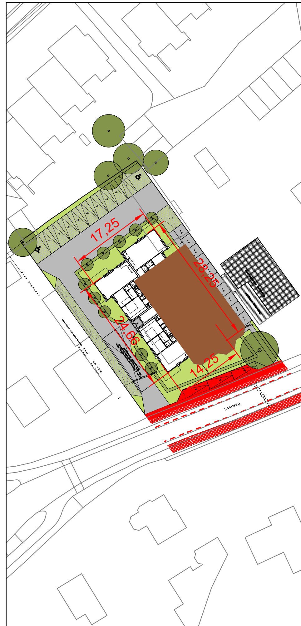
Footprint toekomstige situatie binnen geldend bouwvlak