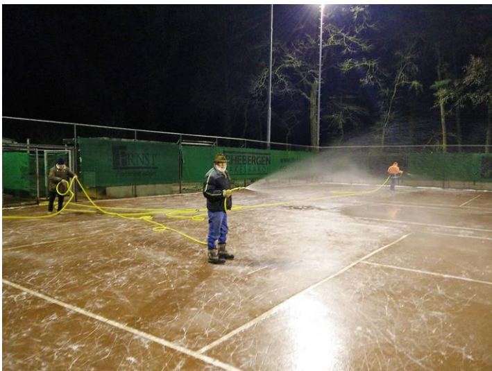
Ijspret Tennisvereniging De Zweepslag