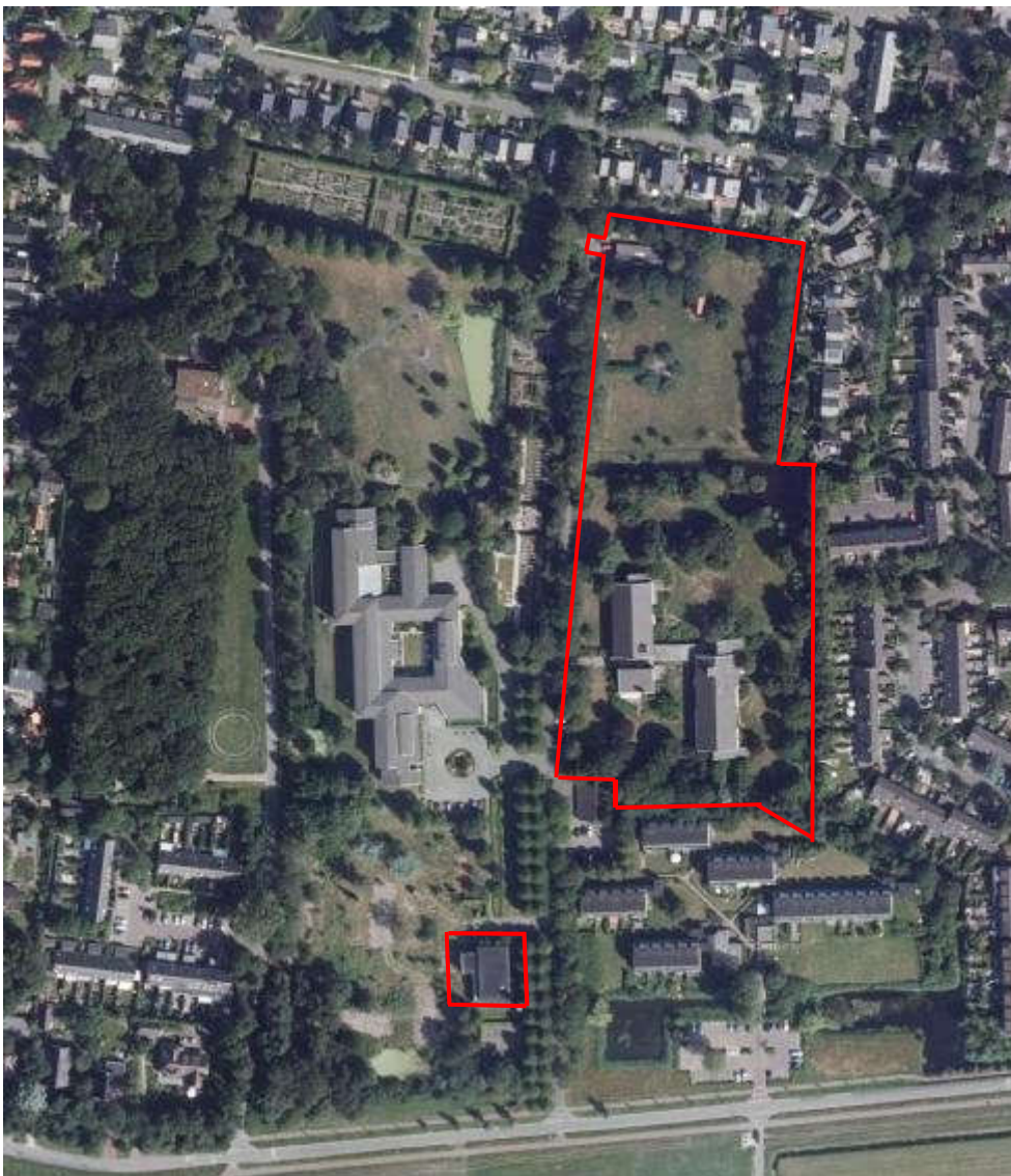
Figuur 2.1: Ligging plangebied

Het plangebied bestaat uit de noordoostelijke gronden van het kloosterterrein aan de Nerdijk, aan de zuidkant van Bergen. Het plangebied wordt aan de westzijde begrensd door de weg die door het midden van het terrein loopt. Aan de noord- en oostzijde liggen de tuinen behorende bij de bestaande woningen aan de Ursulinenlaan. Zowel aan de noord-, oost als zuidzijde sluit het plangebied aan op bestaande waterlopen. In figuur 2.1 is de ligging van het plangebied op de luchtfoto weergegeven.