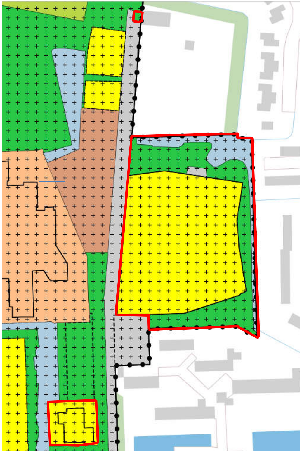
Figuur 1.1: Uitsnede vigerend bestemmingsplan Landgoed Merici (onderdelen plangebied zijn rood omlijnd)

De gronden van het plangebied die thans onderdeel uitmaken van het bestemmingsplan 'Landgoed Merici' zijn hieronder op de uitsnede van de verbeelding weergegeven. De gronden zijn bestemd als Groen, Water, Verkeer – Verblijf, Wonen – 1 en Wonen – 4. Tevens geldt de dubbelbestemming Waarde – Archeologie ter bescherming van mogelijk aanwezige archeologische waarden. De regeling is gelijk aan de regeling in het bestemmingsplan 'Bergen dorpskern zuid'.